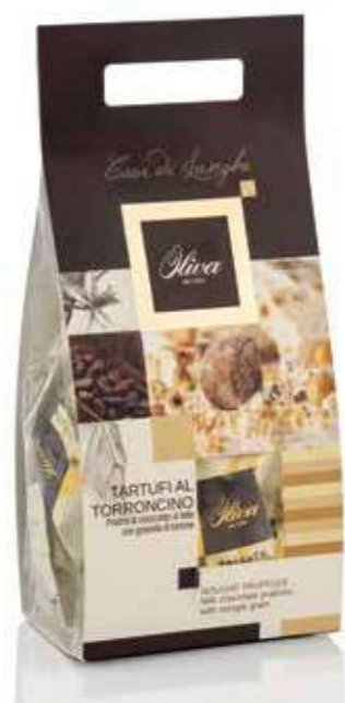
cod. TA/030-160 POCHETTE ‘CUOR DI LANGHE’ TARTUFI TORRONCINO con cioccolato al latte e granella di torrone

Milk chocolate truffles with nougat grain