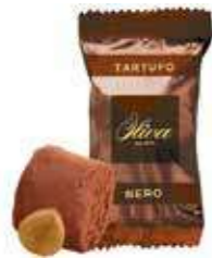
cod. TA/008-2S TARTUFO NERO Black Truffle 17g