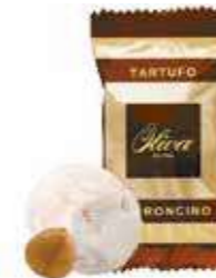
cod. TA/030 TARTUFO TORRONCINO Nougat Truffle 17g