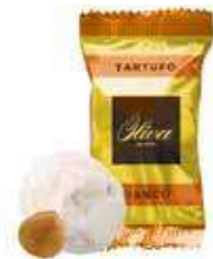
cod. TA/009-2S TARTUFO BIANCO White Truffle 17g