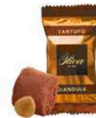
cod. TA/033-2S TARTUFO GIANDUIA Gianduia Truffle 17g