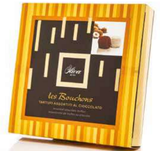
cod. SCA/048 SCATOLA 'GOLD' Tartufi dolci assortiti bianchi e neri Gift box Assorted white and black chocolate truffles 220g - 10 pcs/ct