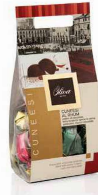
cod. CU/001RR POCHETTE CUNEESEI AL RHUM Guscio extra fondente con ripieno di crema pasticcera e rhum Jamaica Extra dark chocolate shell with custard cream and Jamaica Rhum filling 250g - 16 pcs/ct