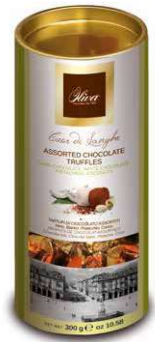
cod.TU/001 TUBO-CIOK TARTUFI MIX

Tartufi di cioccolato assortiti Bianco, Dark, Pistachio, Cocco