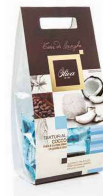
cod. TA/013-160 POCHETTE ‘CUOR DI LANGHE’ TARTUFI COCCO con cioccolato bianco, granella di cocco naturale e nocciole

White chocolate truffles with natural coconut grain and hazelnuts