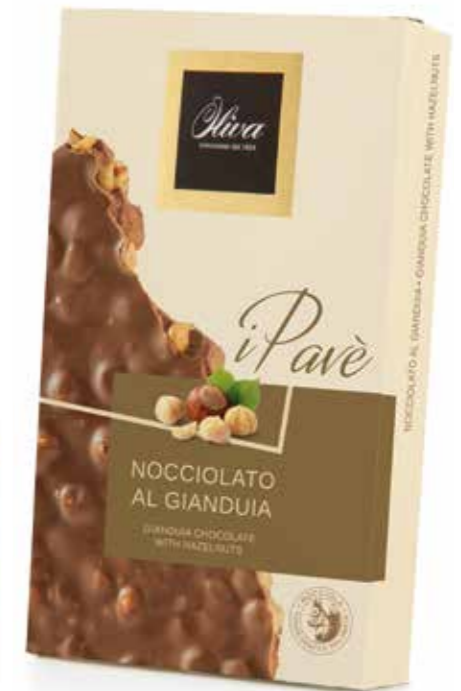
cod. PV/008 LA STRA NOCCIOLATA GIANDUIA

Gianduia chocolate slab with whole hazelnuts