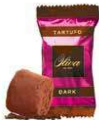
cod. TA/036 TARTUFO DARK con fave di cacao Dark Truffle with cocoa beans 17g