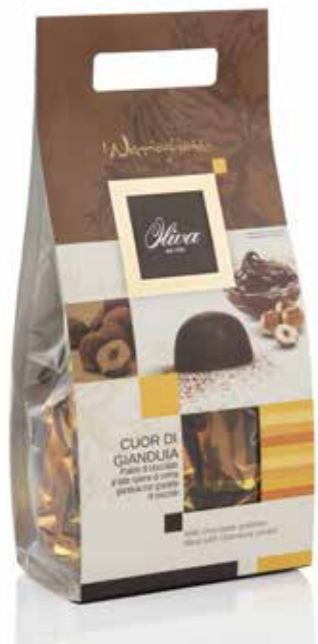
cod. NO/021 POCHETTE NOCCIOGHIOTTI CUOR DI GIANDUIA Guscio extra fondente con ripieno di crema al gianduia Extra dark chocolate pralines with gianduia cream filling 200g - 16 pcs/ct