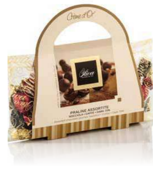
COD. SCA/063 BAGUETTE PRALINE CREME D'OR MIX Praline assortite Nocciola, Caffè, Dark 70%

Assorted chocola pralines Hazelnut, Coffee, 70% Dark