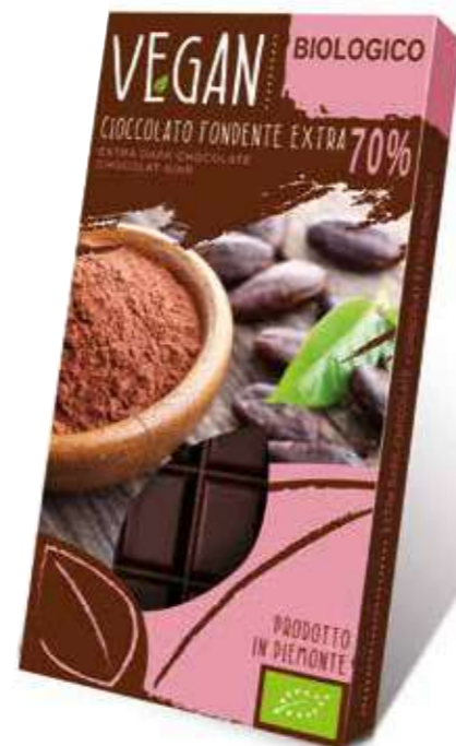
cod. VG/003 TAVOLETTA BIO-VEGAN 70% CACAO

Organic 70% dark chocolate bar suitable for Vegan diet