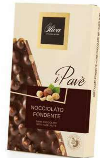
cod. PV/006 LA STRA NOCCIOLATA FONDENTE 70% CACAO

70% Dark chocolate slab with whole hazelnuts