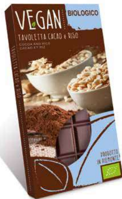
cod. VG/004 TAVOLETTA BIO-VEGAN CACAO-RISO

Organic Cocoa-rice bar suitable for vegan diet