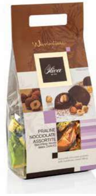
cod. NO/010Q POCHETTE NOCCIOGHIOTTI MIX Praline di cioccolato assortite Nocciola, Bacio, Gianduia Assorted chocolate pralines Hazelnut, Bacio, Gianduia 200g - 16 pcs/ct