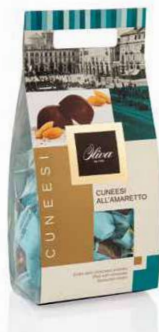
cod. CU/006RR POCHETTE CUNEESEI ALL'AMARETTO Guscio extra fondente con ripieno di crema alcolica all'Amaretto Extra dark chocolate shell with alcoholic Amaretto cream filling 250g - 16 pcs/ct