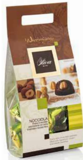
cod. NO/018-SS NOCCIOGHIOTTI NOCCIOLA Guscio extra fondente con ripieno di crema di nocciole e nocciola intera Extra dark chocolate pralines with whole hazelnut and cream filling 200g - 16 pcs/ct