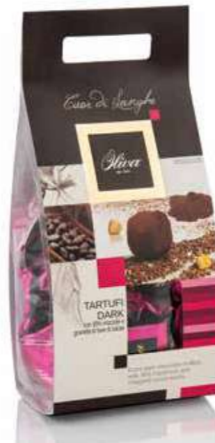
cod. TA/042-DK POCHETTE ‘CUOR DI LANGHE’ TARTUFI DARK Tartufo nero con 30% nocciole e fave di cacao

Dark chocolate truffles with 30% hazelnuts and cocoa beans