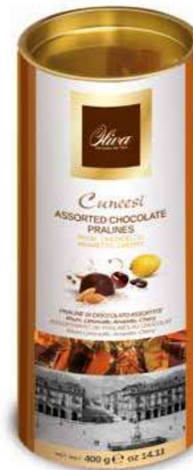
cod.TU/002 TUBO-CIOK CUNEESI MIX

Cuneesi assortiti Rhum, Limoncello, Caffè, Amaretto, Cherry