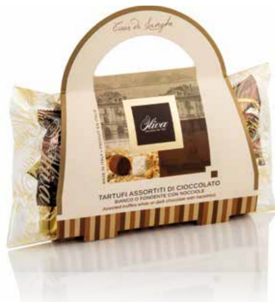
COD. SCA/062 BAGUETTE TARTUFI ‘CUOR DI LANGHE’ Tartufi di cioccolato assortiti Bianchi e neri

Assorted white and black chocolate truffles