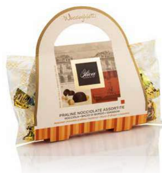
COD. SCA/061 BAGUETTE NOCCIOGHIOTTI MIX Praline nocciolate assortite Nocciola, Bacio, Gianduia

Assorted hazelnut pralines Hazelnut, Bacio, Gianduia