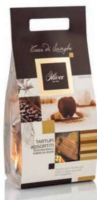
cod. TA/005-160 POCHETTE ‘CUOR DI LANGHE’ TARTUFI ASSORTITI bianchi e neri con 24% nocciole

Assorted white and black chocolate truffles with 24% of hazelnuts