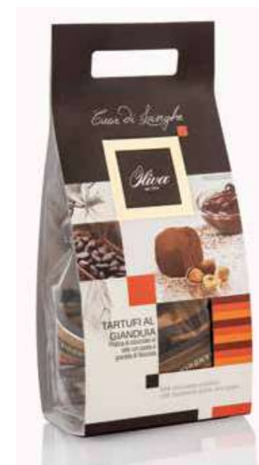
cod. TA/033-160 POCHETTE ‘CUOR DI LANGHE’ TARTUFI GIANDUIA con cioccolato alle nocciole gianduia

Gianduia chocolate truffles with 25% hazelnuts