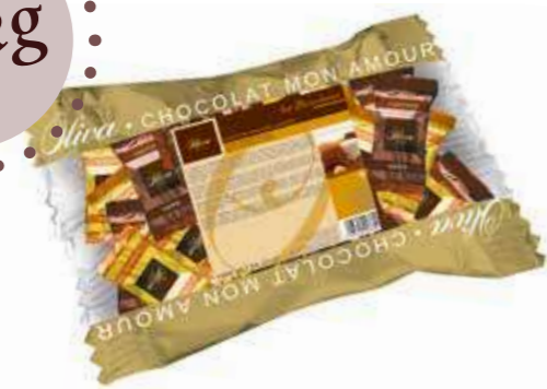
cod. TA/007-2S TARTUFI MIX Assorted white and black Chocolate truffles Busta a cuscino Pillow bag 1kg - 6 pcs/ct