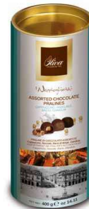
cod.TU/003 TUBO-CIOK NOCCIOLIOTTI MIX

Praline assortite Nocciola, Bacio di Borgo, Gianduia, Crème d'Or