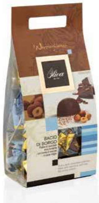
cod. NO/006 POCHETTE NOCCIOGHIOTTI BACIO DI BORGO Guscio extra fondente con ripieno di crema e pasta di nocciole Extra dark chocolate pralines with Hazelnut cream filling 200g - 16 pcs/ct