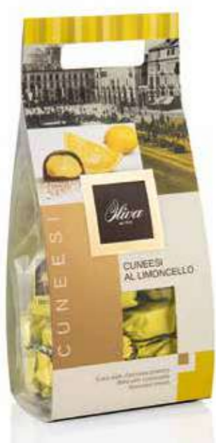
cod. CU/014RR POCHETTE CUNEESEI AL LIMONCELLO Guscio extra fondente con ripieno di cioccolato bianco e Limoncello Extra dark chocolate shell with white chocolate and Limoncello cream filling 250g - 16 pcs/ct

Chocolate pralines with liqueur creams in total bag