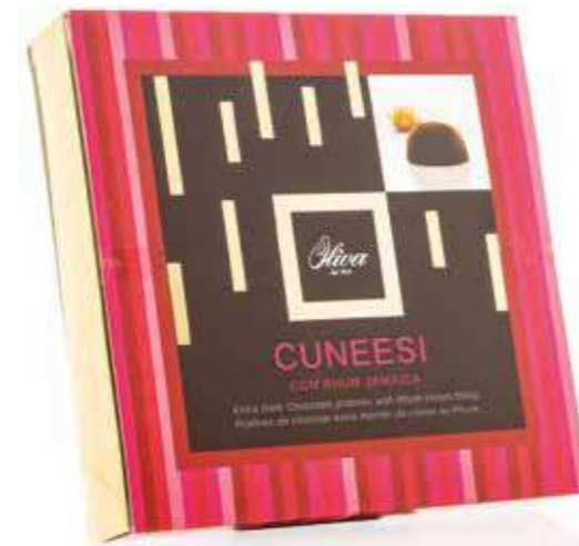
cod. SCA/049 SCATOLA 'GOLD' Cuneesi al Rhum Gift box Cuneesi with Rum 250g - 10 pcs/ct