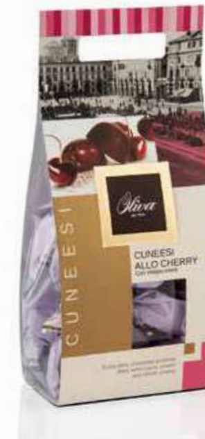
cod. CU/010RR POCHETTE CUNEESEI ALLO CHERRY Guscio extra fondente con ripieno di crema alcolica allo Cherry e Amarena intera Extra dark chocolate shell with whole Cherry in alcoholic cream filling 250g - 16 pcs/ct