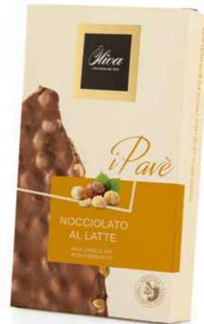
cod. PV/007 LA STRA NOCCIOLATA LATTE

Milk chocolate slab with whole hazelnuts