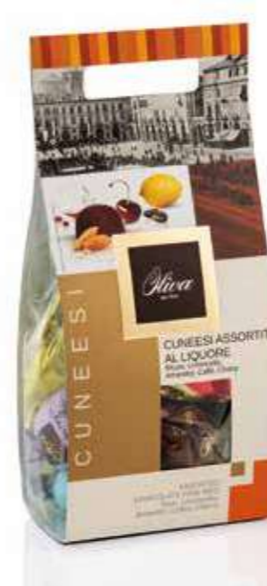
cod. CU/016RR POCHETTE CUNEESEI MIX LIQUORE Rum, Limoncello, Amaretto, Cherry, Caffè Assorted chocolate pralines with liqueur cream Rum, Limoncello, Coffee, Amaretto, Cherry 250g - 16 pcs/ct