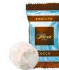
cod. TA/019 TARTUFO COCCO Coconut Truffle 17g